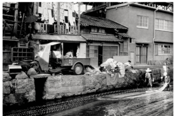
友禅の水洗い 白川（昭和30年）