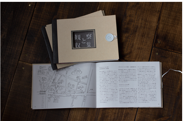
配布は左京西部いきいき市民活動センターの他、左京を中心としたカフェやお店でも置いていただいています。(*配布部数が限られていますので、ご希望の方は一度スタッフまでお声掛けください)

2015年5月から、2016年3月までの約1年間を通して活動してきた「左京ペーパーメディアプロジェクト」では、活動の集大成として、36ページの紙メディア『観察と収集』を3月に発行しました。本プロジェクトは、参加者たちが「編集」の手法や、誰にでもある「編集の力」に気づき、学び、考えながら、“まち”を捉える様々な視点を引き出すことを目的に開催してきたものです。まちを歩き、気になったことや新しい発見を書き留め、その情報を左京区のエリアごとに分け、オリジナルの地図とともに掲載しています。