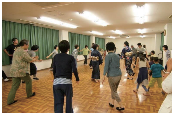
盆踊りの練習風景です(左京西部いきいき市民活動センター)。

音楽や踊りを通じて、子どもを始めとするいろいろな人が交流する事業を行います。音楽や踊りは言葉や世代を超えて楽しめるものですから、交流の輪をできるだけ広くしたいと考えています。演奏を聴くだけでなく、演奏に合わせて踊ったりしたいと思っています。踊るのはこの地域でかつて行なわれていた「盆踊り」です。「盆踊り」はまさに老若男女誰でも楽しめるものです。特にこの頃は、昔の盆踊りを知らない世代に静かなブームとなっています。6月から9月にかけて、以下の事業を行います。