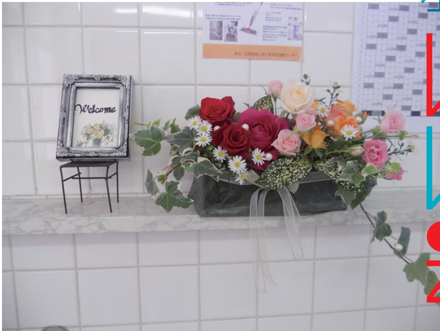
↑取材に伺った日の作品。入口右側の流し台か何かの跡は、作品を皆に見えるように置くにはうってつけなのだとか。