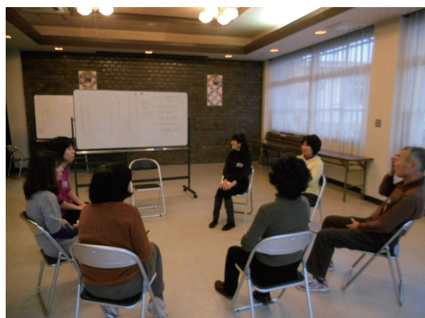
次回の「50歳からはじめる演劇講座」は、2016年6月29日(水)14時~16時。詳しくは左京西部いきいき市民活動センターまでお問い合わせください。

全国でシニア世代の演劇活動がたいへんな盛り上がりを見せています。シニア演劇の魅力はどこにあるのでしょうか。例えば、認知症予防にとって「適度な運動」「知的好奇心の刺激」「コミュニケーションの活性化」の三点が重要だそうです。シニア演劇はまさにこの三点を満たしています。演劇は自分の体を使った活動なので、大きな声を出す、準備運動をするという「適度な運動」が不可欠です。また脚本を読む、登場人物の心情を想像するといった「知的好奇心の刺激」も求